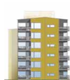
Vy från väster.