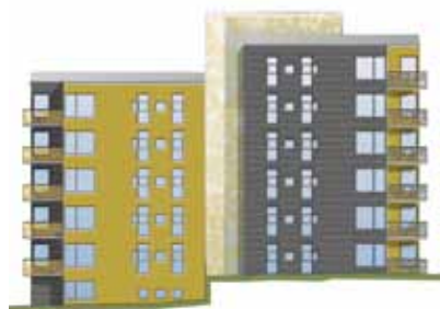
Vy från norr.