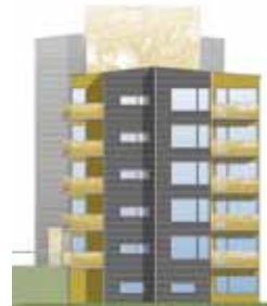
Vy från öster.