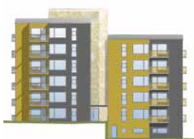
Vy från söder.